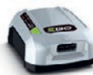
PRO X Ladegerät